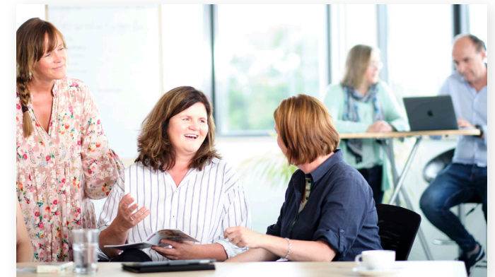
Menschen im Mittelpunkt

Plane deine Zukunft und werde Teil des Pflüger-Teams